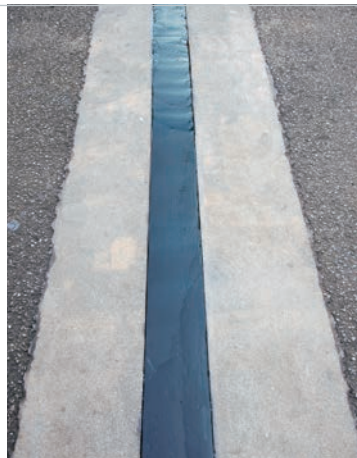
荷重支持型ゴムジョイントの補修(東京都文京区)

劣化したゴムが路面に露出することで、走行車両が損傷したり、二輪車転倒事故を引き起こす危険性がある