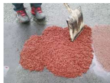
カラータイプもあります